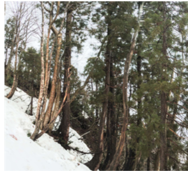
④ DSC_9338 10段目上の樹木右端斜面 左ホオノキ株立 中央根曲スギ 左根曲スギ R04.03.20AM0926

撮影箇所を示します。 此処は冬季堅雪の2月から3月にかけての残雪時にしか訪れることのできない処です。 岩村展望台から連なる稜線は厳しい風雪に晒されて樹木は独特の姿を見せます。 稜線に沿って天然スギがその岩肌に根を食込ませています。 緩傾斜面にある天然スギも見事です。 自然の中で生き抜く樹木の力強さを感じます。