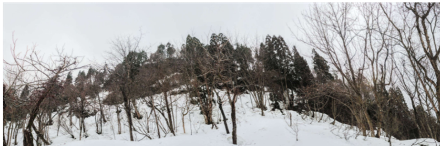
① DSC_9312 7段目左オニグルミ 真中オニグルミ8段目右ホオノキ (蔓アジサイ枯花付) R04.03.20AM0909