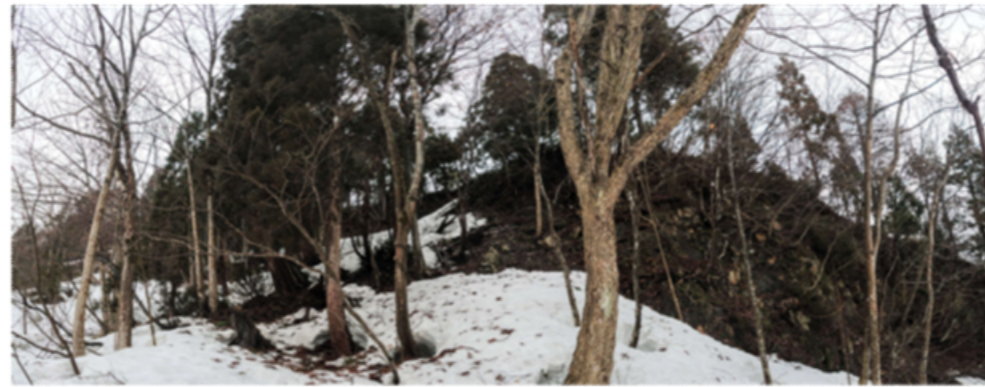
⑤ DSC_9355 岩村展望台稜線の02 前面ホオノキ コハウチワカエデ キハダ 背面根曲スギ R04.03.20AM0936