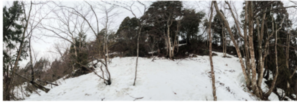
② DSC_9328 10段目の樹木 上部稜線スギ 手前中央ホオノキ株立 右ホオノキ株立 R04.03.20AM0921