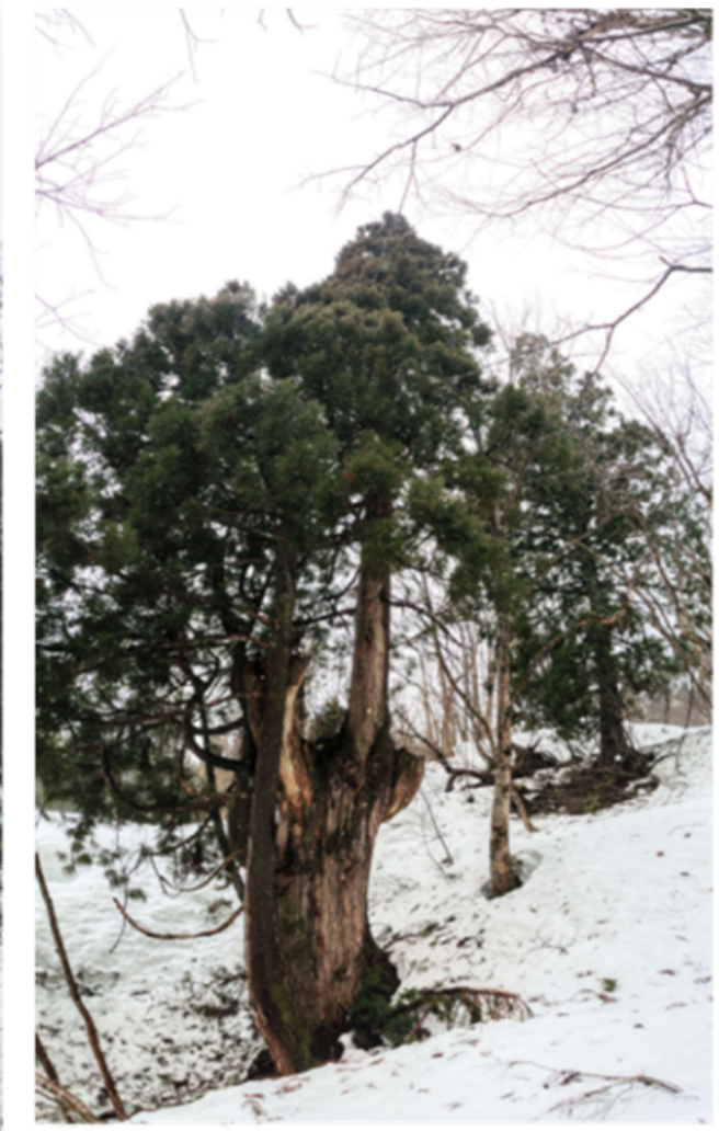
⑬ DSC_9427 天スギ04 R04.03.20AM1004