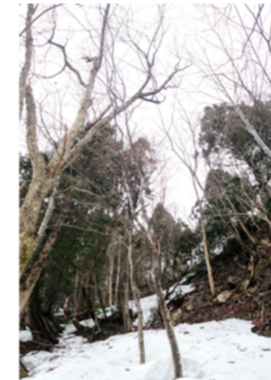
⑦ DSC_9362 オニグルミ ホオノキ コハウチワカエデアオダモ R04.03.20AM0938