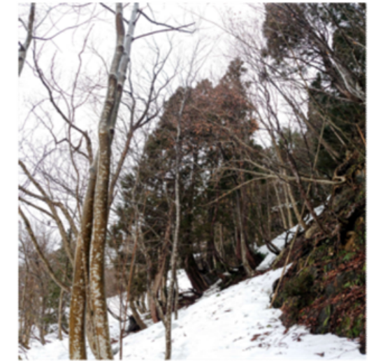
⑧ DSC_9386 岩村展望台稜線の06から振り返って03 風化流紋岩溶岩壁 根曲スギと左ホオノキ R04.03.20AM0944