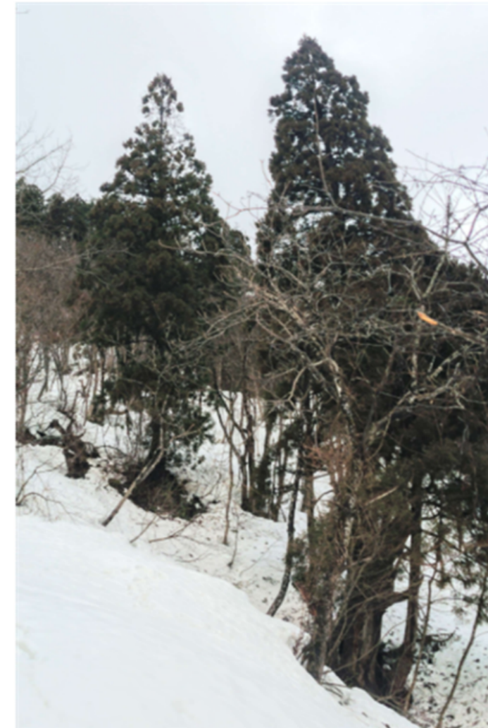
⑭ DSC_9443の2 天スギ13 R04.03.20AM1018